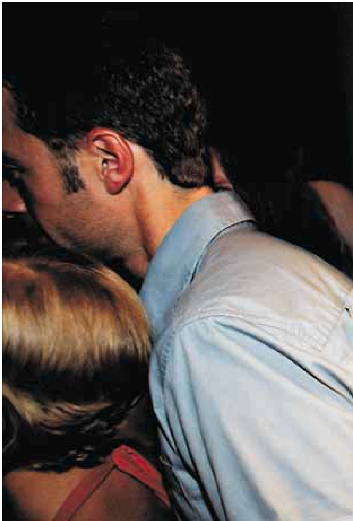
INTENST: Når bildene blir delt ut, starter jakten på kandidatene som datamaskinen har plukket ut for deg.

– Dette er den mest tåpelige greia jeg har vært med på. Vi er 12 jenter som er ute sammen, og alle er misfornøyde. De matchene de setter sammen, er innmari dårlige. Dette er håpløst – nå drar vi på Smuget, erklærer hun.